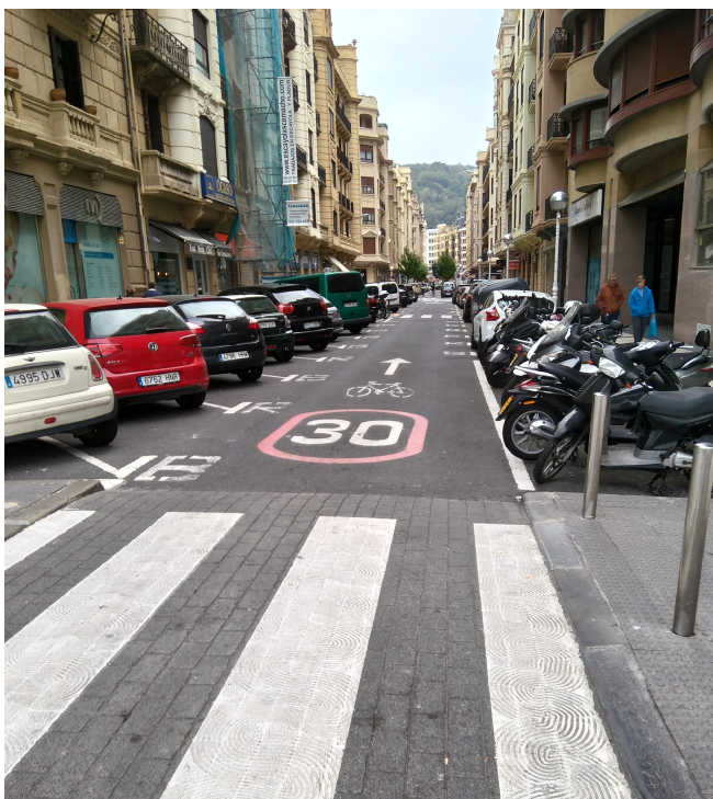
Zona 30 en San Sebastián, ciclo-calle con prioridad ciclista y estacionamiento en rotación (zona verde para residentes).

3 er escenario (conservador, entorno escolar pacificado) – Ciclocalle en Zona 30. Ampliación de aceras y recrecido de orejas. Creación de una zona estancial en la entrada del colegio con posibilidad de elevación de la plataforma. Trazado del carril de circulación sinuoso (en curva) y más estrecho. Esta disposición simplifica la parada/recogida de los niños “en carrusel” con tiempos de espera muy reducidos y peligrosidad mínima. Existe un ejemplo similar en el Colegio San Viator de Vitoria-Gasteiz. Eliminación de aparcamientos frente al colegio, entorno escolar seguro.