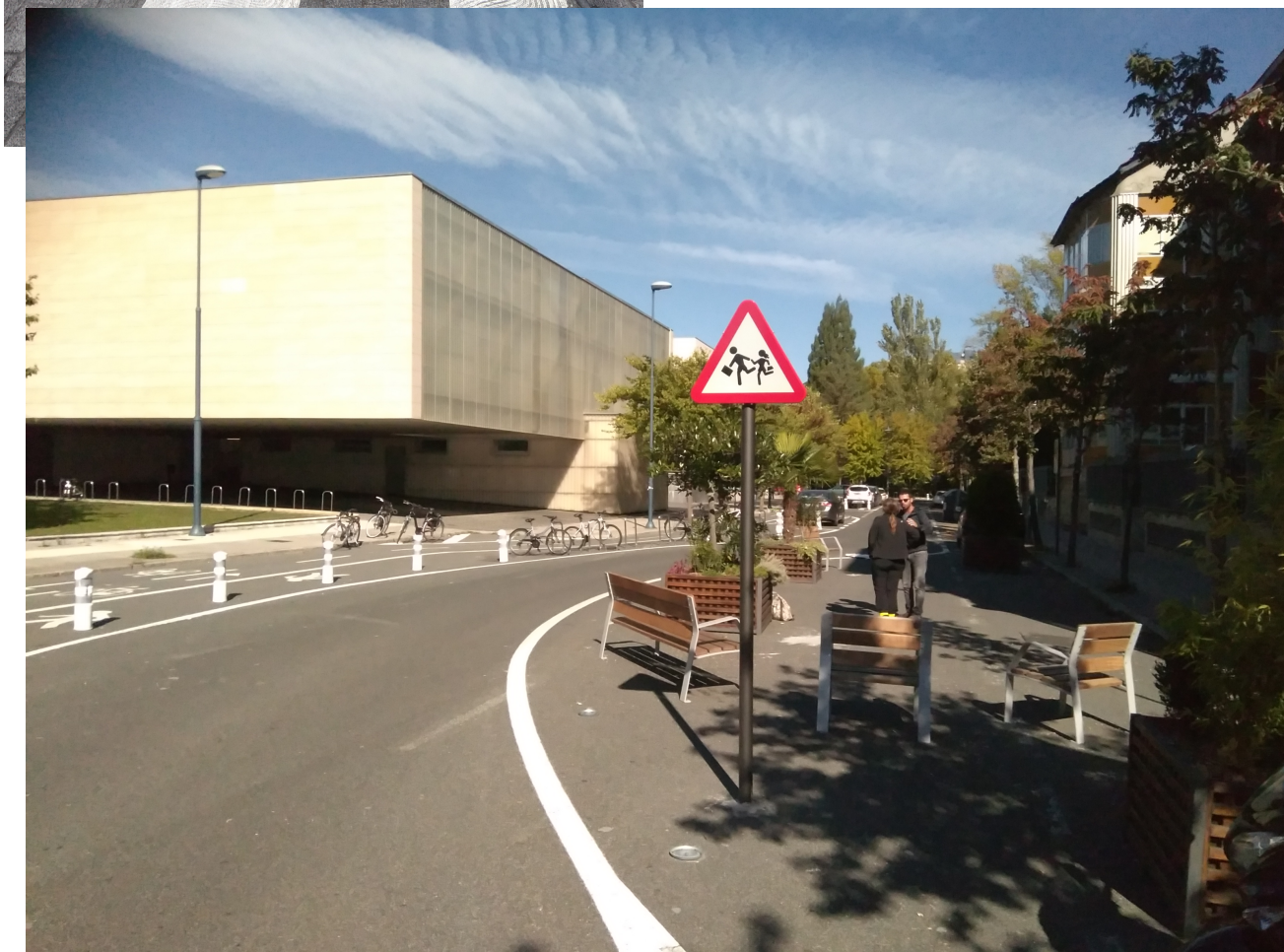
Entorno escolar con zona estancial en colegio San Viator de Vitoria-Gasteiz, calle Argentina.