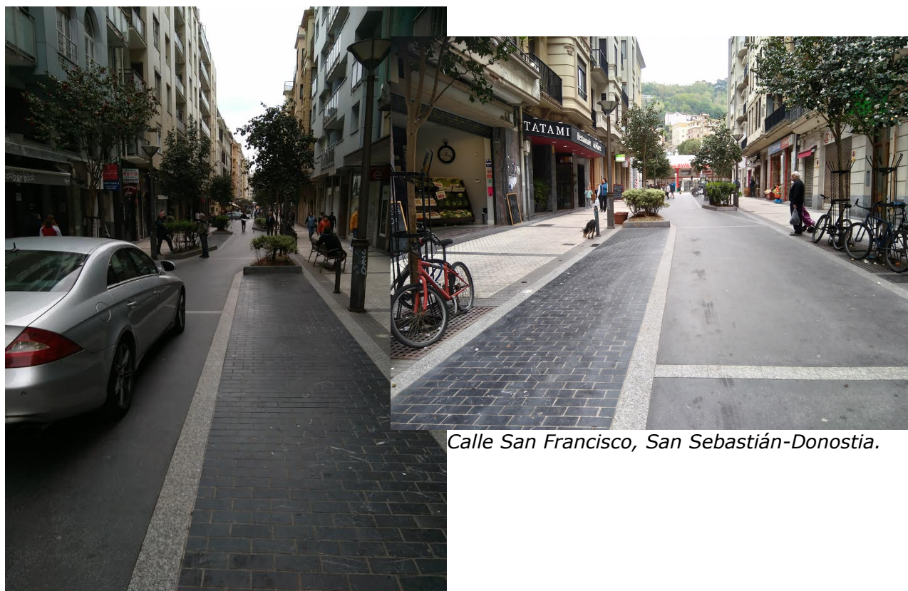
Calle San Francisco, San Sebastián-Donostia.