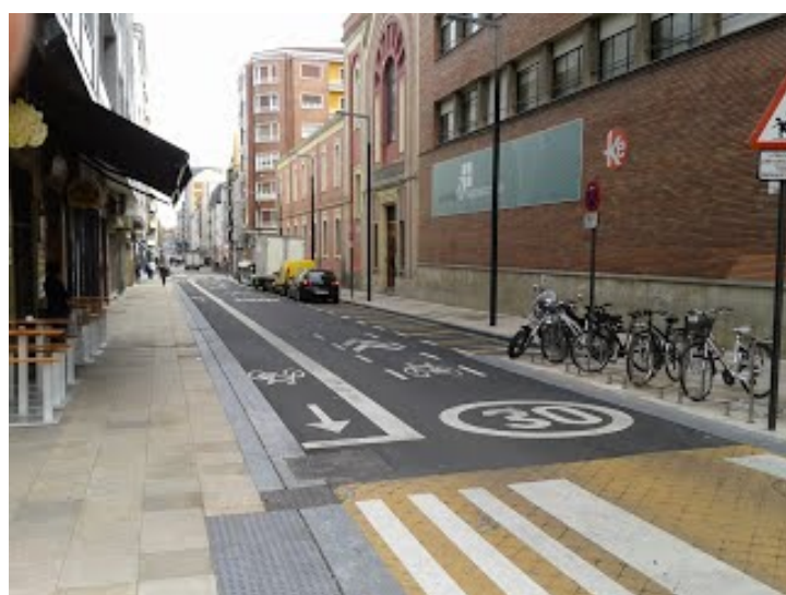
Ciclo-carriles CC30 en calzada y doble sentido ciclista en Vitoria-Gasteiz